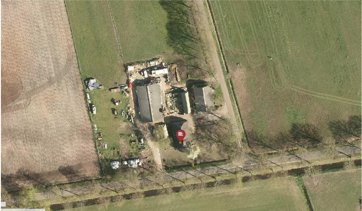
Luchtfoto huidige situatie Kampendwarsweg 1