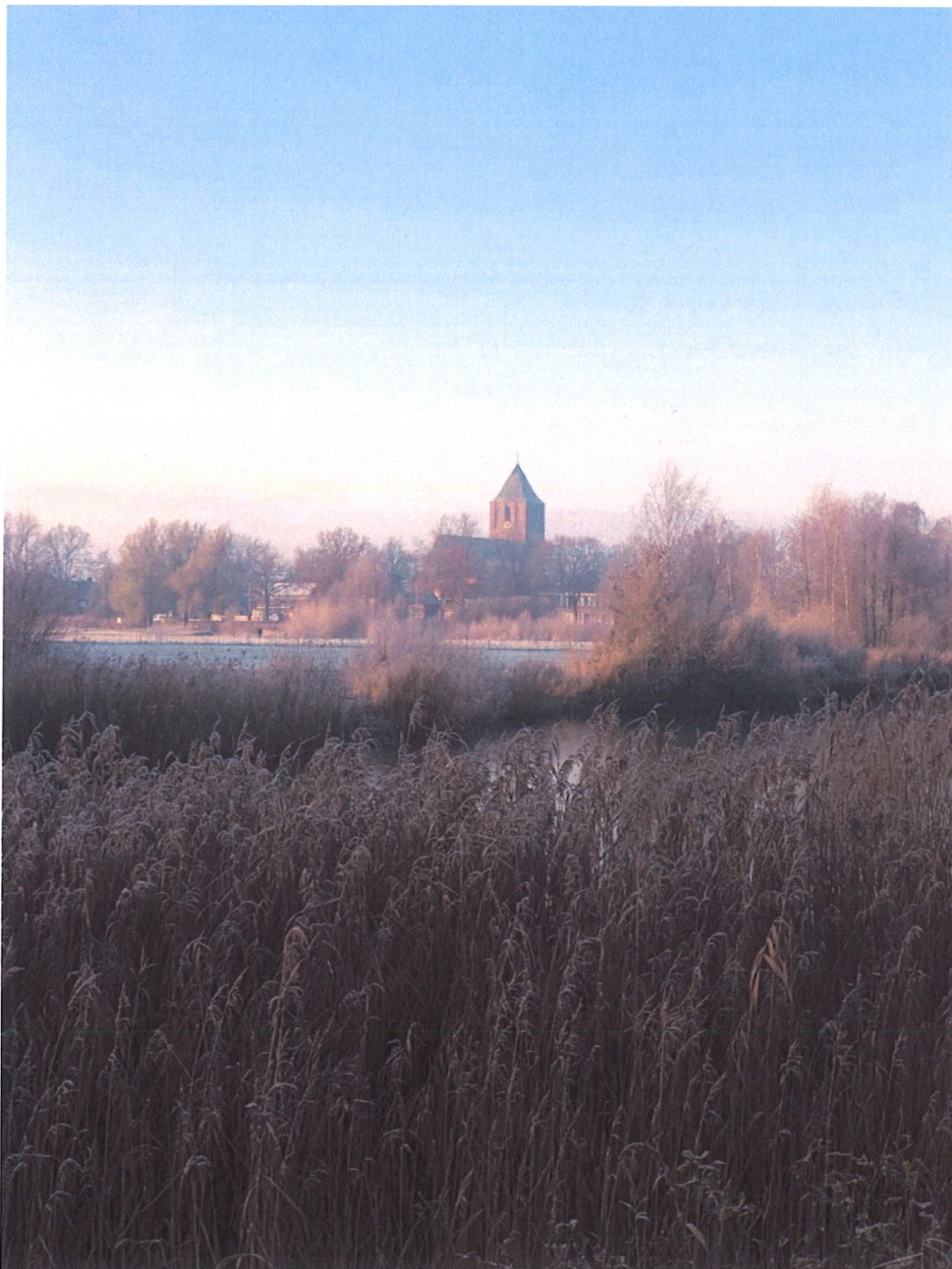
Zicht vanaf de Brinkweg

Onderstaande foto's tonen de huidige situatie;