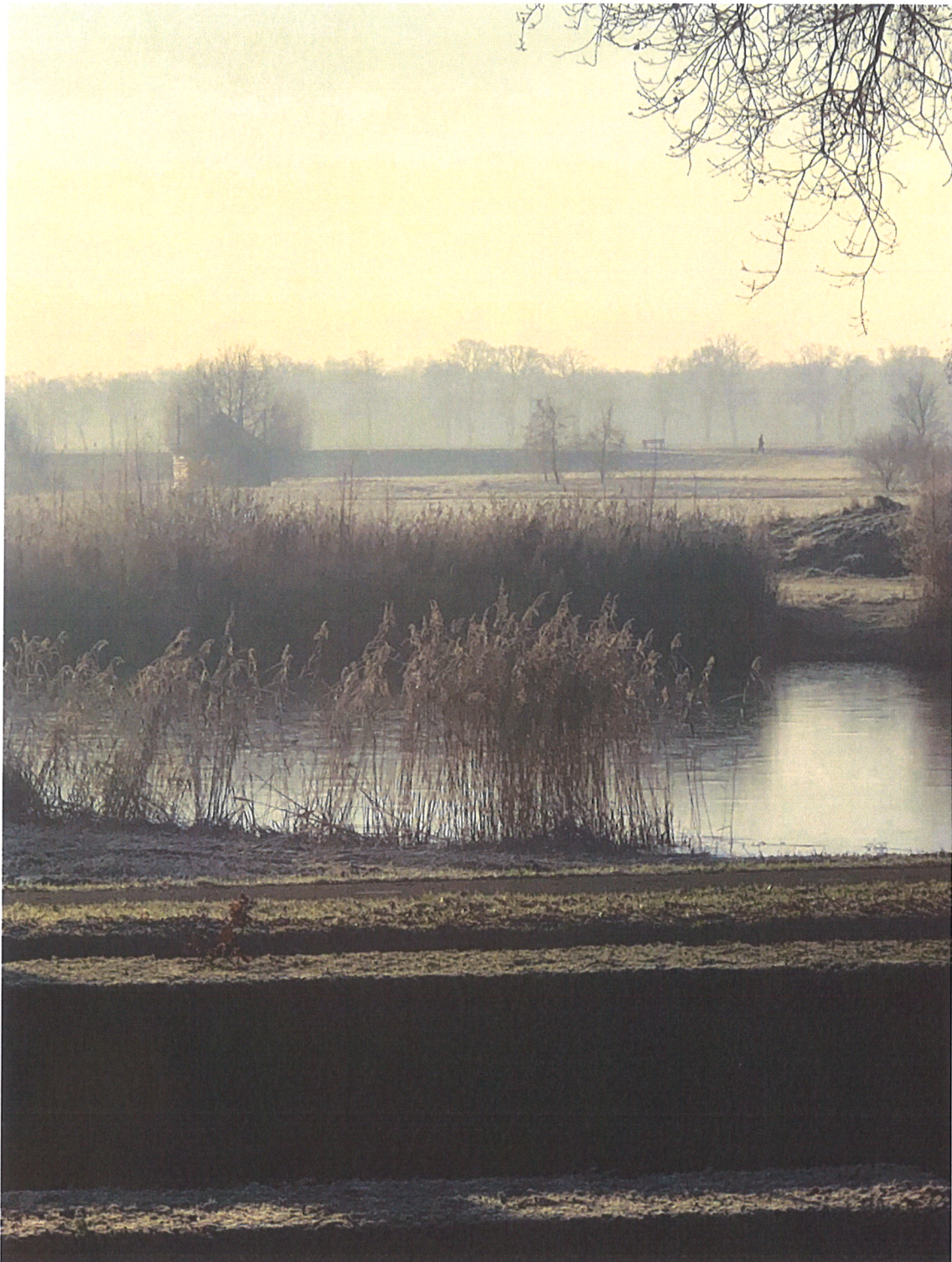
Zicht vanaf Welsummerweg ter hoogte no. 9-13 De geplande locatie doorkruist deze zichtlijnen!!