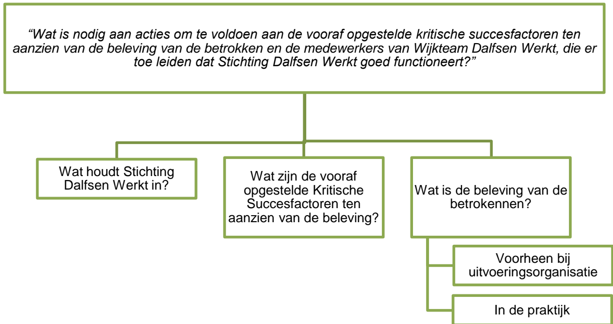
Figuur A.a. boomdiagram

“Wat is nodig aan acties om te voldoen aan de vooraf opgestelde kritische succesfactoren die er toe leiden dat Stichting Dalfsen Werkt goed functioneert?”